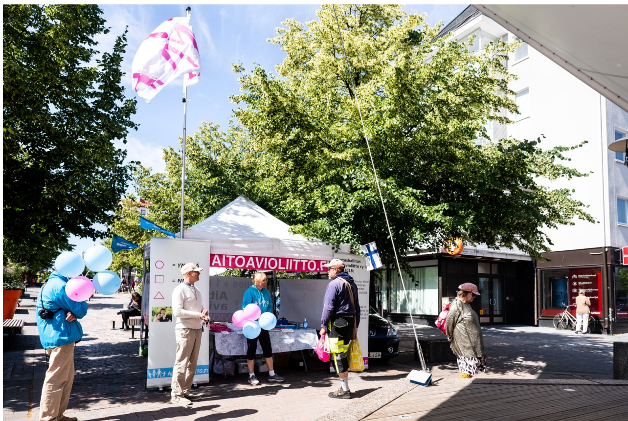
Aito avioliitto -yhdistyksen edustajia Kokkolan Purjeen luona keskiviikkona.