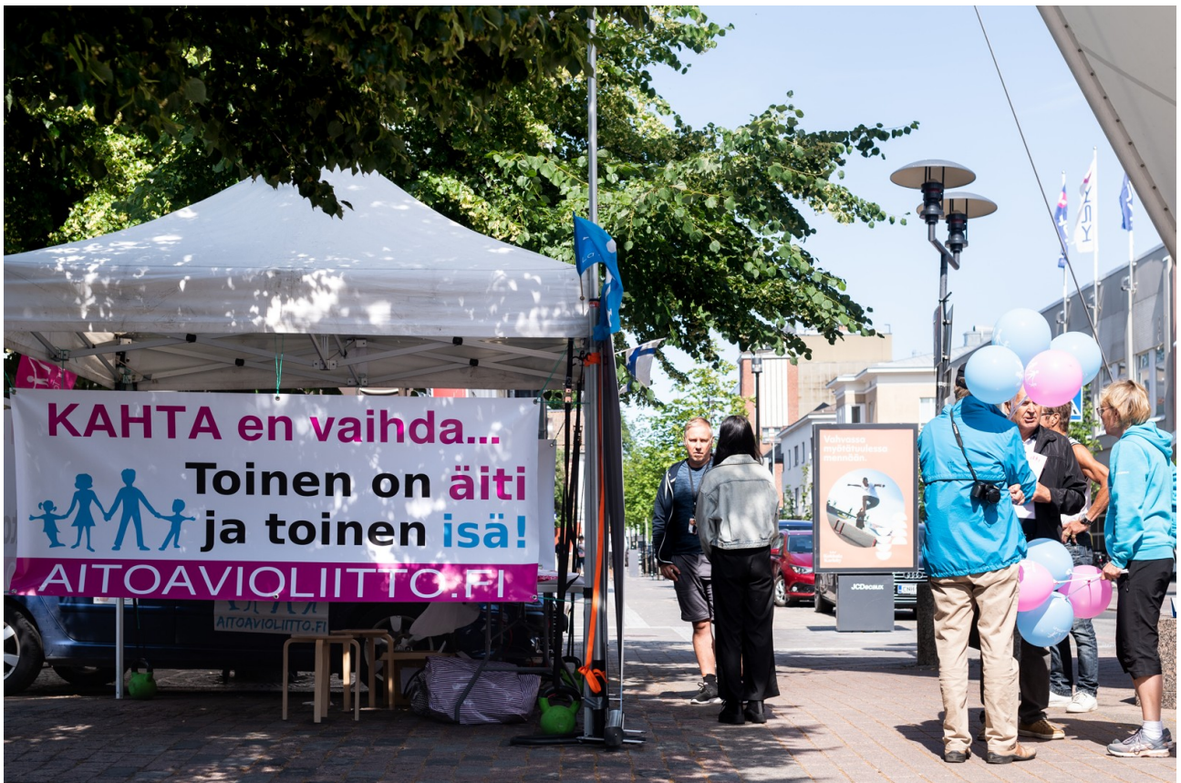
Kokkolasta kiertue jatkoj kohti Raumaa.